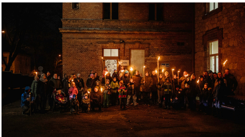
Skolas kopiena pirms došanās lāpu gājienā 11.novembrī