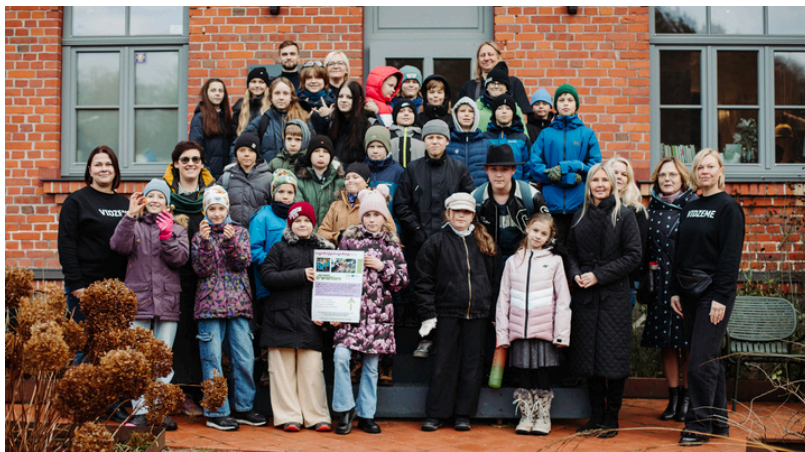
Skolēni ciemoties restorānā "Pavāru māja" pēc uzvaras konkursā "Ko celšim galdā skolas pusdienās?"